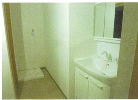
洗面台・洗濯機置場